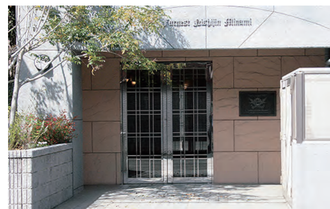
マンション1階のエントランス。オートロックで安心です。