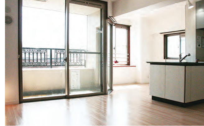
リビングスペースとダイニングスペースがあり快適です。