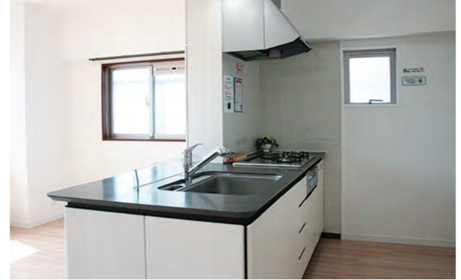
採光窓がある、とても明るいキッチンです。