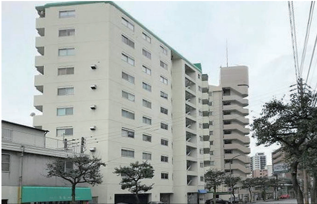
市営地下鉄空港線「西新駅」まで徒歩5分。隣には西鉄ストアレガネットがあり、通勤・買物もたいへん便利です。

④福岡市営地下鉄「西新駅」400m(徒歩5分) ⑥福岡市立西新小学校 1000m(徒歩14分) ③福岡市立百道中学校 1940m(徒歩25分) ②西鉄ストアレガネット城西店 80m(徒歩1分) ⑤ショッピングモール「プラリバ」420m(徒歩6分) ⑦福岡銀行西新町支店 550m(徒歩7分) ⑧西日本シティ銀行西新町支店 500m(徒歩7分) ④早良郵便局 960m(徒歩12分) ①福岡大学西新病院 690m(徒歩9分) ①福岡市早良区役所 1480m(徒歩19分)