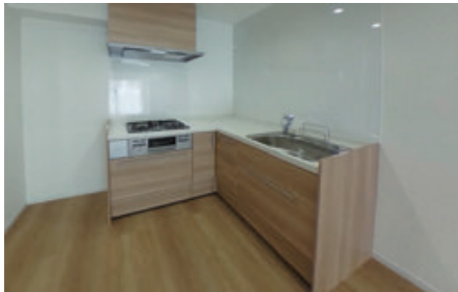
【キッチン】リビングとデザインが統一されてお洒落です。