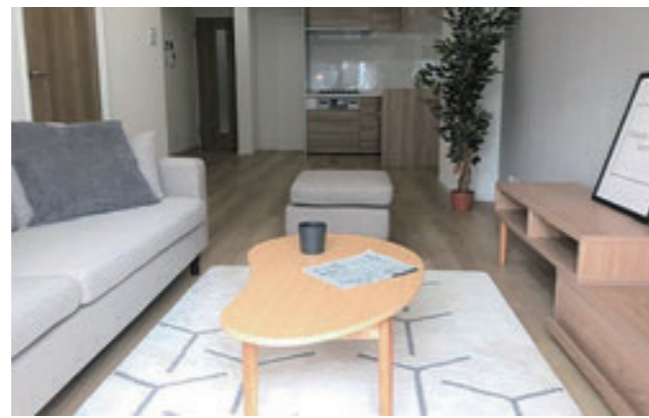
【LDK】リビングにはほらんの家具が設置されています。