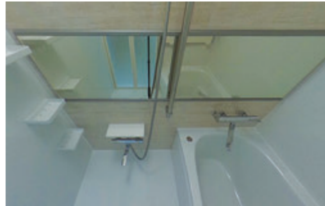
【浴室】一日の疲れを癒す快適なお風呂です。

Enjoy Life Communication 福岡県知事(1)第19325号 ELCOM 株式会社 エルコム 〒810-0011 福岡市中央区高砂2丁目6-2 ニチエイ高砂ビル4F