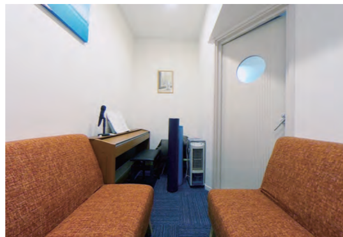
リビングに増設された防音カラオケルーム。