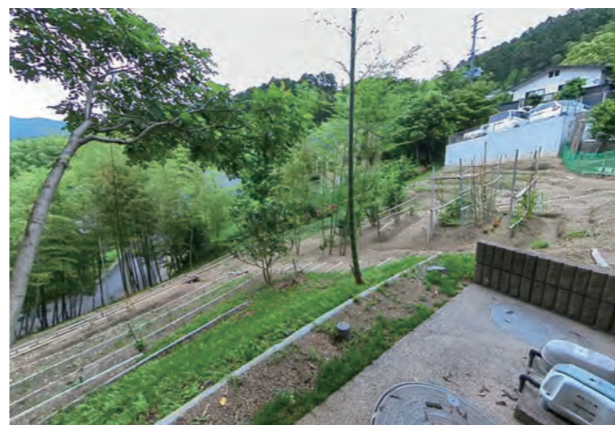
きれいに整地された庭と畑。右上に見えるのが駐車場。